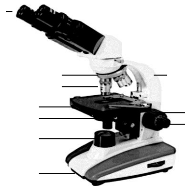
Figura 2. Microscopio compuesto