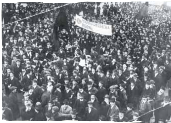
El movimiento cartista, contó cada vez con más seguidores.

Ante la presión y persecución, los seguidores del movimiento cartista se reorganizaron y vieron la posibilidad de elegir parlamentarios afines a su causa. De igual forma, los obreros vieron en el movimiento el camino para presionar cambios en el país, gracias a que cada día que pasaba se sumaban más