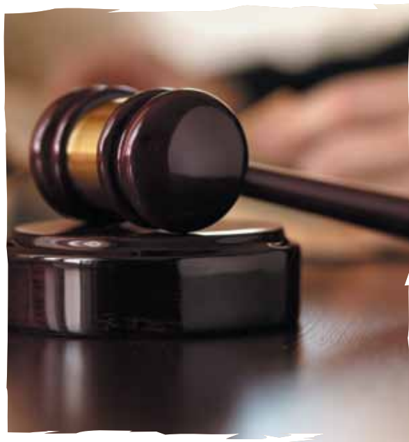
A los acusados se les dio la pena máxima.

El 1° de mayo comenzó la huelga. La parálisis fue total y en la tarde se iniciaron las marchas, los conservadores convencieron a los socialistas, a los anarquistas y a otros movimientos de izquierda para que las movilizaciones se realizaran en total orden y de forma pacífica, pero las fuerzas del orden y algunos saboteadores, al parecer contratados por los empresarios, generaron el caos. Al finalizar las protestas se presentaron choques con la policía, que recibió la orden de no permitir reuniones.