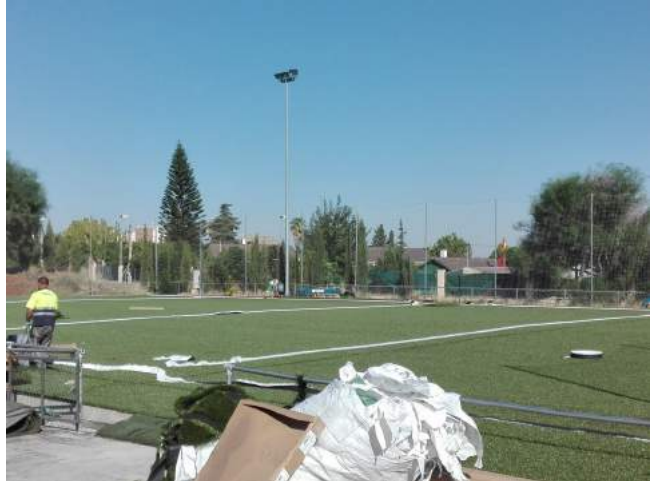
El nuevo campo de fútbol en obra