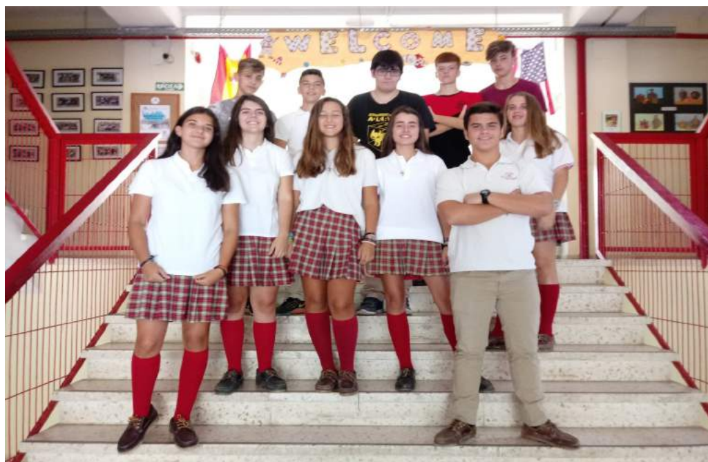
Nuevo equipo de redacción del periódico.