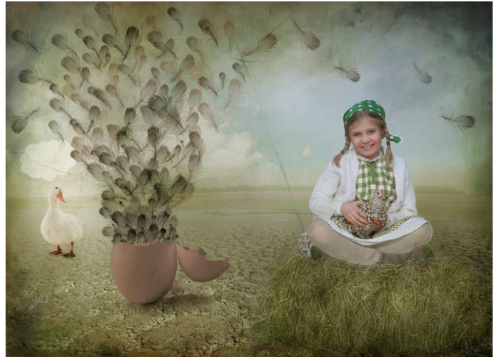
Kuva 14. Lapsen Maailma -lehden kansi 4/2016