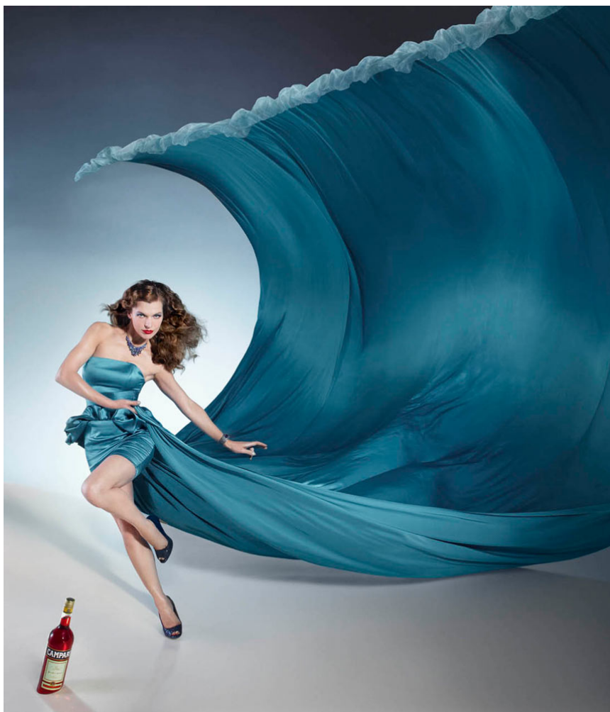
Kuva 9. Palkitun mainoskuvaaja Dimitri Daniloffin Camparille tekemä mainos. Daniloff on tunnettu näyttävistä kuvamanipulaatioistaan (Webneel.)

Manipuloidut kuvat herättävät ja ovat aina herättäneet hämmennystä ja vilkasta keskustelua niiden eettisyyden vuoksi. Pahimmillaan kuvien manipulointia on käytetty jopa rikolliseen toimintaan esimerkiksi Kiinassa, missä kommunistipoliitikkojen kasvoja on yhdistetty aikuisviihdenäyttelijöiden vartaloihin ja näin poliitikoilta on pystytty kiristämään miljoonia dollareita (The Daily Dot, 2013).