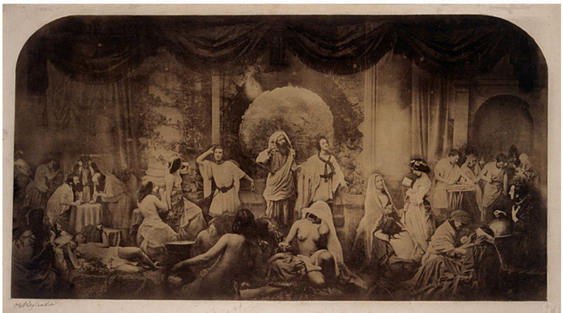
Kuva 5. Oscar Gustave Rejlanderin "The Two Ways of Life" vuodelta 1857

Taidevalokuvauksen isänä pidetään Oscar Gustave Rejlanderia, joka todennäköisesti loi ensimmäiset fotomontaasit. Hänen teoksensa The two ways of Life vuodelta 1857 muodostui 32 negatiivista. Hän valokuvasi jokaisen kuvan erikseen ja lopulta kuvasi ne yhdeksi teokseksi. Kuvan luominen kesti kuusi viikkoa. Kuvassa nuori mies pätkäilee siveellisen ja paheellisen elämän vaihtoehtoja. Vaikka kuva herätti alastomuuden takia pahennusta viktoriaanisessa Englannissa, itse kuningatar Viktoria osti kuvasta kopion puolisolleen 10 guinealla. (Codex99; PetaPixel 2013a; Saraste 1980, 81.)