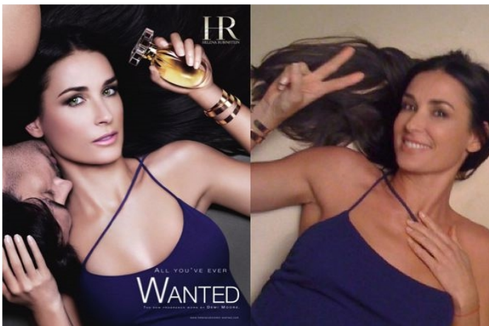
Kuva 7. Kuva näyttelijä Demi Mooresta Helena Rubinsteinin mainoksessa ennen ja jälkeen kuvankäsittelyn

Muotikuvissa ihmisten vartaloa ja kasvoja käsitellään näyttämään toisenlaisilta kuin ne luonnollisesti ovat. Pyrkimyksenä on saada ihmiset näyttämään mahdollisimman edustavilta. Iho silotetaan epätasaisuuksista ja rypyistä, vartalon kokoa ja mittasuhteita muutetaan ja sävyjä kirkastetaan. Mediassa esiintyvät muokatut naisvartalot ovat aiheuttaneet vilkasta keskustelua niiden nuorille tytöille ja naisille aiheuttamien ulkonäköpaineiden takia. Niiden sanotaan olevan ainakin osittainen syy lisääntyneisiin syömishäiriöihin, masentuneisuuteen ja huonoon itsetuntoon. Amerikassa on yritetty saada läpi lakialoite Truth in Advertising Act, joka kieltäisi ihmisten kuvien manipuloinnin mainonnassa juuri terveysystistä. Israelissa astui voimaan uusi laki vuonna 2013, ja nyt kuvien yhteydessä tulee ilmoittaa erikseen, jos niitä on käsitelty. (The Brave Girls Alliance; Govtrack; The Jewish Week.)