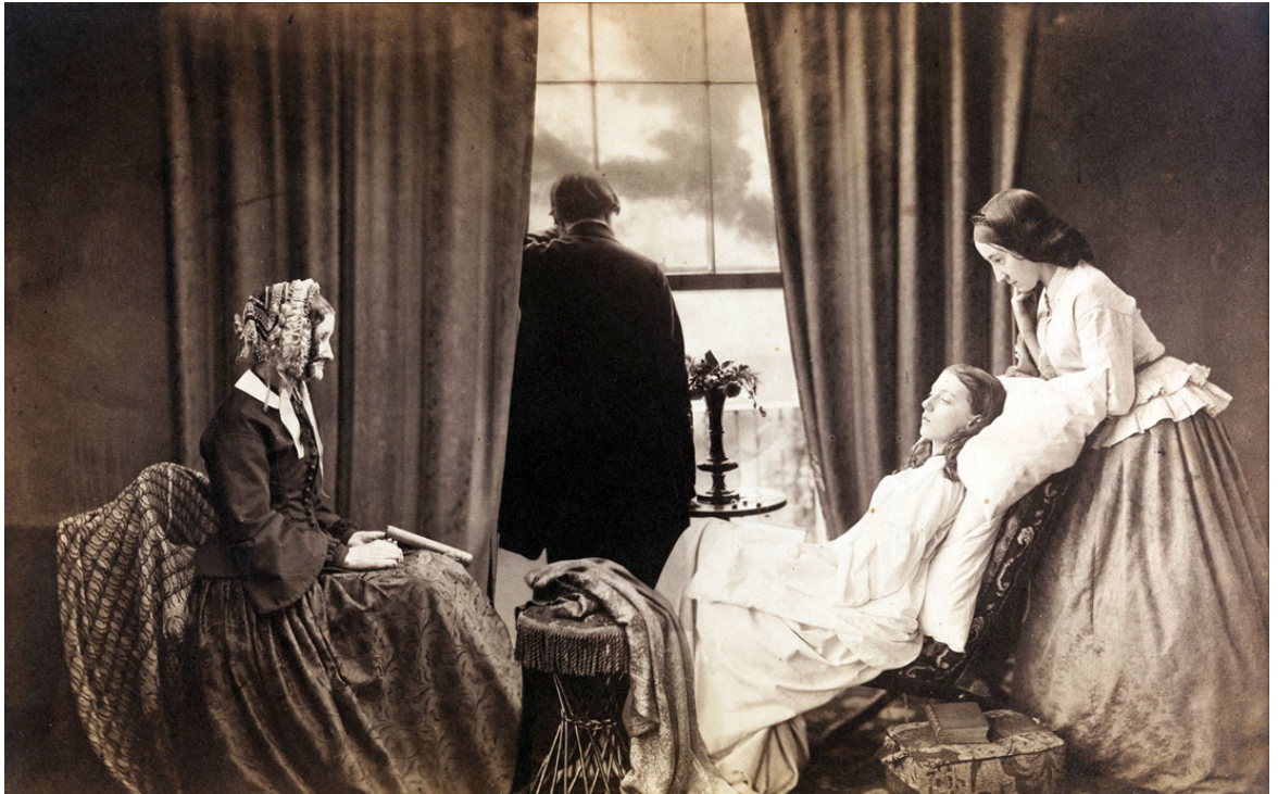
Kuva 6. Henry Peach Robinsonin fotomontaasi "Fading Away" vuodelta 1858