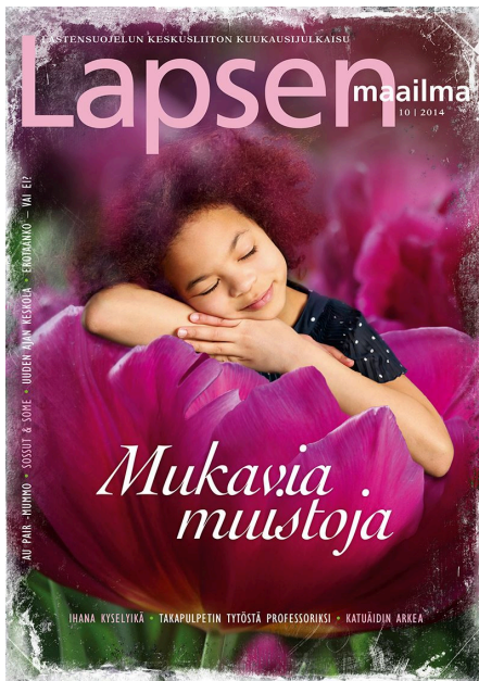
Kuva 17. Edit-kilpailuun valittu kansi 2015