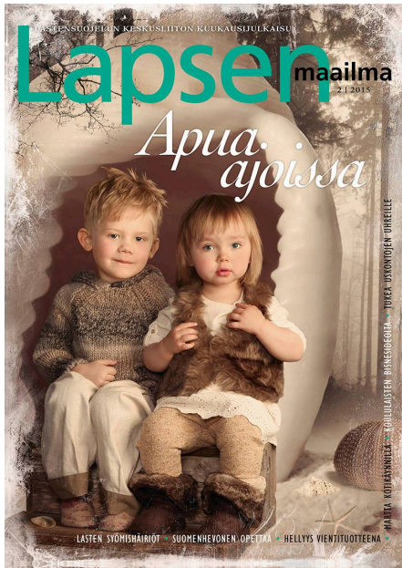
Kuva 16. Edit-kilpailuun valittu kansi 2016