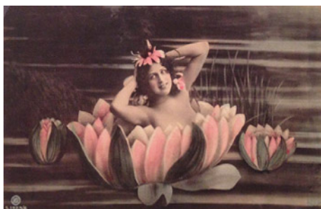
Kuva 12. Saksalaisen Rotophotin fantasiakortti noin vuodelta 1908 (Kuva: Kalha 2012, 115)

Kalha pohtii teoksessaan korttien suhdetta modernin taiteen kehitykseen. Hän toteaa, että vaikka massatuotetut kuvat eivät juurikaan kuulu taidehistoriaan, niillä on oma roolinsa modernismin kehityksessä (Kalha 2012, 6). Kortit ovat taidetta ja edustavat omaa aikakauttaan miniatyyrisine ja esteettisine universumeineen. Vaikka vanhoissa korteissa elää fantasia, myös realistiset tapahtumat vaikuttivat. Korteissa käsiteltiin esimerkiksi sotaa ja aikakauden keksintöjä.