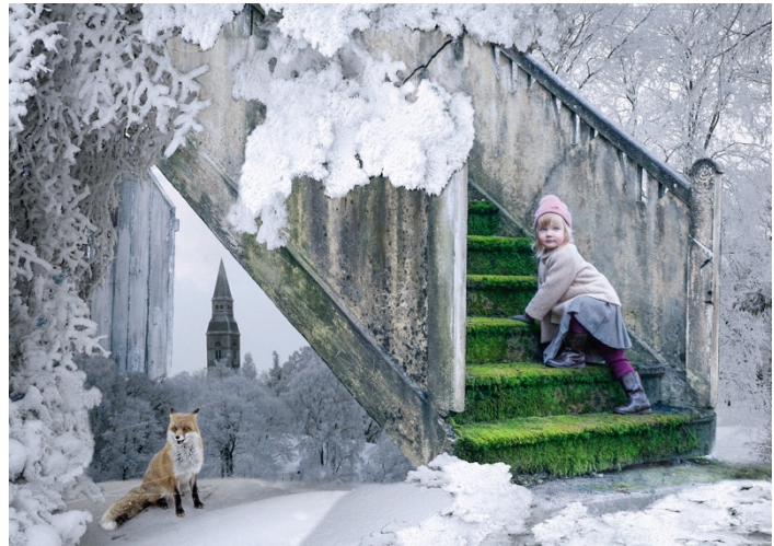
Kuva 15. Lapsen Maailma -lehden kansi 1/2016