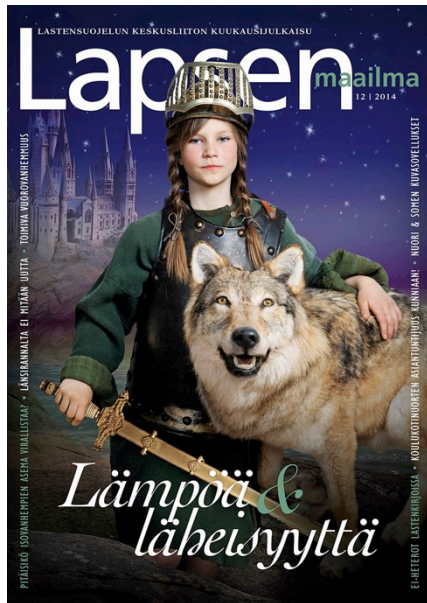
Kuva 1. Lapsen Maailma -lehden kansi 12/2014

Täytyy ihan erikseen kehua kantta: tyttöritari suden kanssa puhutteli minua kovasti. Ihmisiä lokeroidaan perinteisiin sukupuolirooleihin muutenkin ihan tarpeeksi, joten on hienoa, jos Lapsen Maailman kanssa voi olla tyttö tai poika, pitkä- tai lyhyttukkaisena, esiintymässä sellaisena kuin on, ilman valmista roolijakoa. (Anni Kytömäki, kirjailija, Lapsen Maailma -lehden kolumnisti)