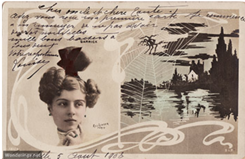
Kuva 13. Reutlingerin art nouveau -tyyppinen postikortti vuodelta 1903