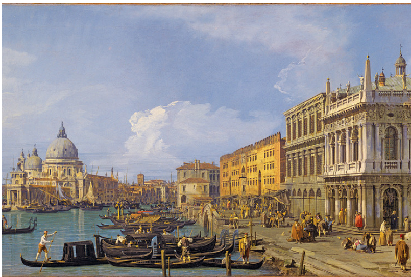
Kuva 3. Canaletton taulu Venetsiasta vuodelta 1730

1700-luvun italialainen taidemaalari Canaletto käytti camera obscuraa maisemamaalauksen apuna ja sai näin tehtyä tarkan piirroksen Venetsiasta (The National Gallery). Canaletto kuitenkin kaunisteli maalauksissaan todellisuutta ja teki niistä värikkäitä ja eloisia.