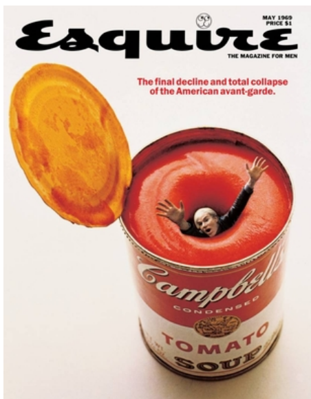
Kuva 11. Esquiren retusoitu kansi vuodelta 1969

Komposiittikuvia käytetään ajoittain kansi- ja kuvituskuvina lehdistössä. Kuvien tulee sopia lehden linjaan ja ilmeeseen. Suomalaisen aikakauslehtien kansissa komposiittikuvia on ollut Talouselämässä ja Suomen Kuvalehdessä , ulkomaisissa lehdissä Esquinessä , Time ssa ja Newsweek issä. Miehillä suunnattu Esquire -lehti on tehnyt erikoisia ja erottuvia kansia 1930-luvulta lähtien, muun muassa miniatyyrin Andy Warholista, joka uppoaa Campbellin tomaattikeittopurkkiin.