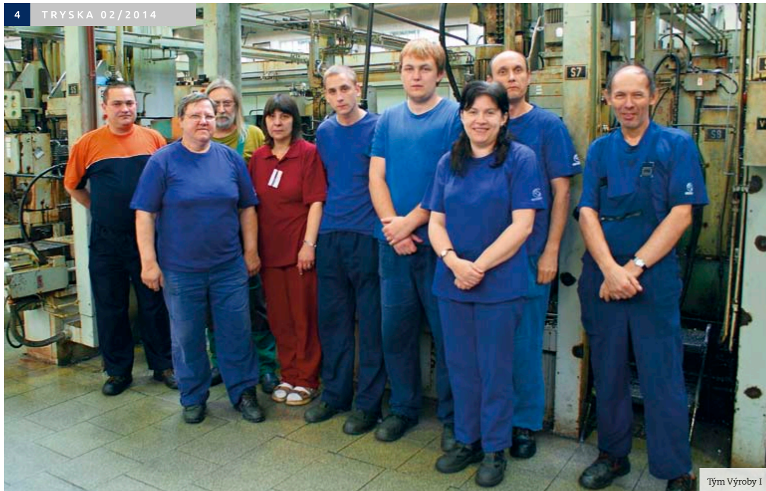
Tým Výroby I