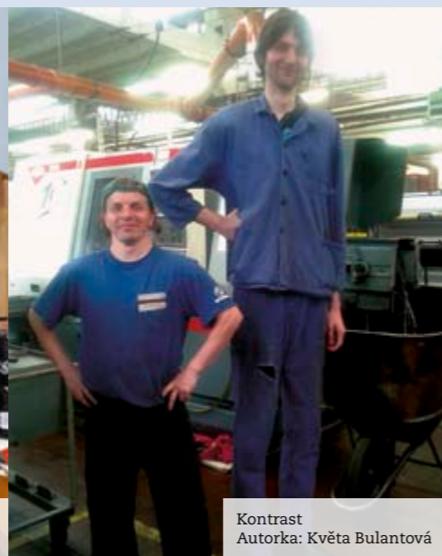
Kontrast Autorka: Květa Bulantová