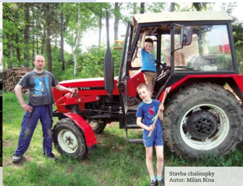
Stavba chaloupky Autor: Milan Bína