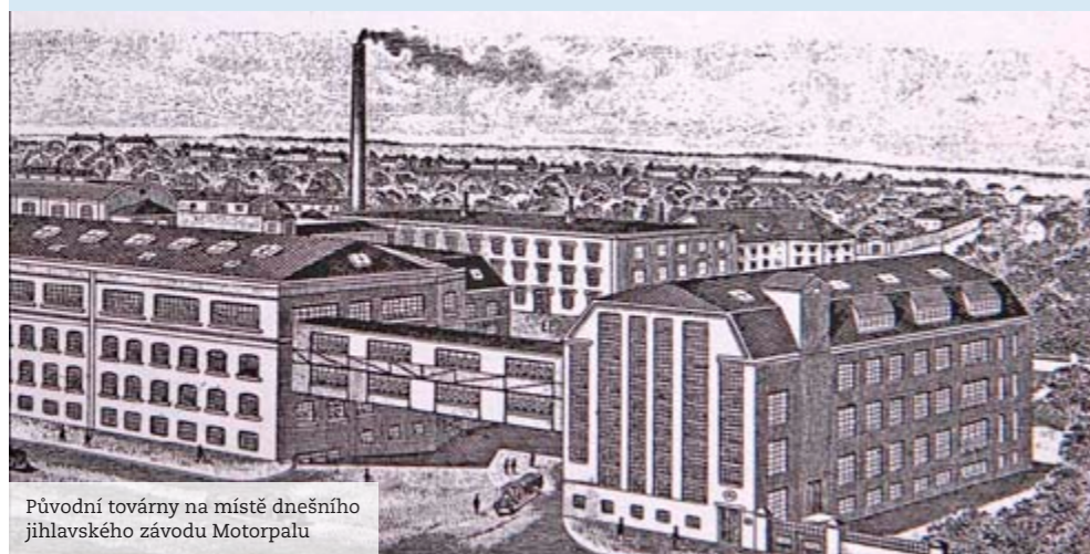
Původní továrny na místě dnešního jihlavského závodu Motorpalu