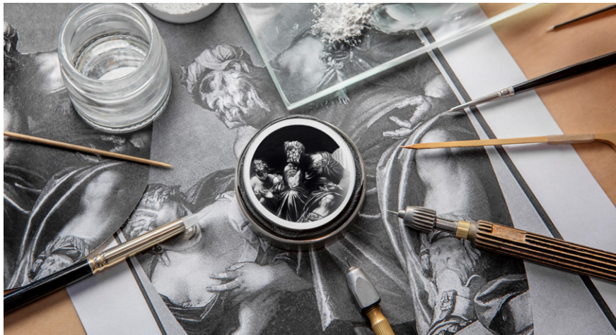
Esfera inspirada por la obra de Veronese La juventud y la vejez (Saturno) , creada para la exposición Homo Faber en Venecia (Italia).

El esmalte grisalla es un arte que apareció en el siglo XVI y consiste en superponer toques de un raro esmalte blanco, llamado blanco de Limoges, en una capa de esmalte oscuro que cubre la base de la esfera dorada. Cada capa de esmalte se pasa después por el horno, respetando escrupulosamente un tiempo de cocción definido al milímetro.