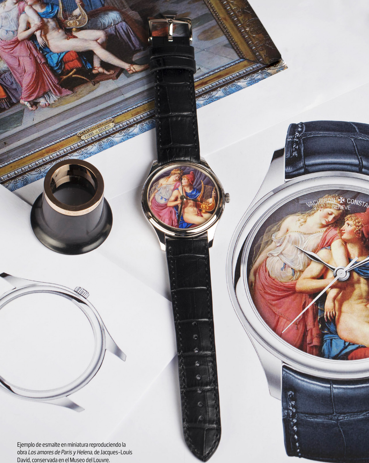
Ejemplo de esmalte en miniatura reproduciendo la obra Los amores de París y Helena , de Jacques-Louis David, conservada en el Museo del Louvre.