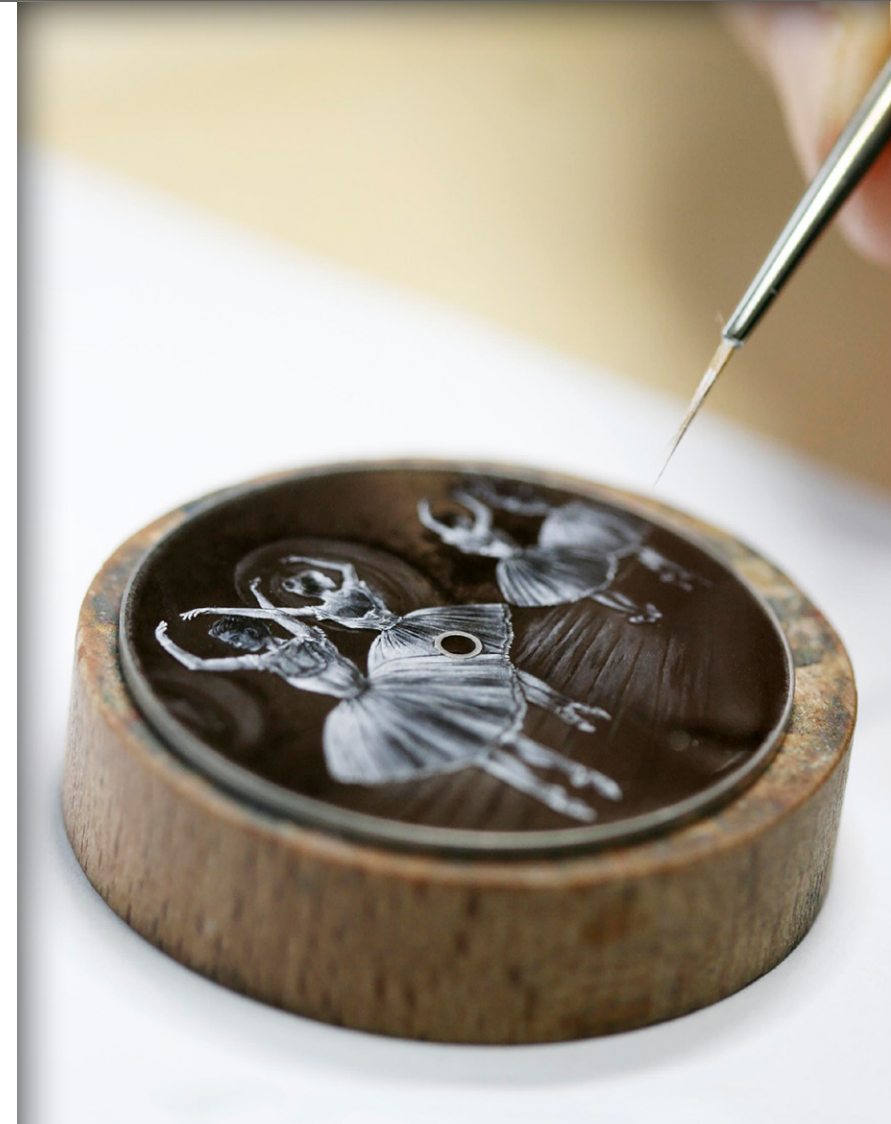
Esfera en esmalte grisalla del reloj Vacheron Constantin Métiers d'Art, Homenaje al arte de la danza, reproduciendo las obras de Edgar Degas.