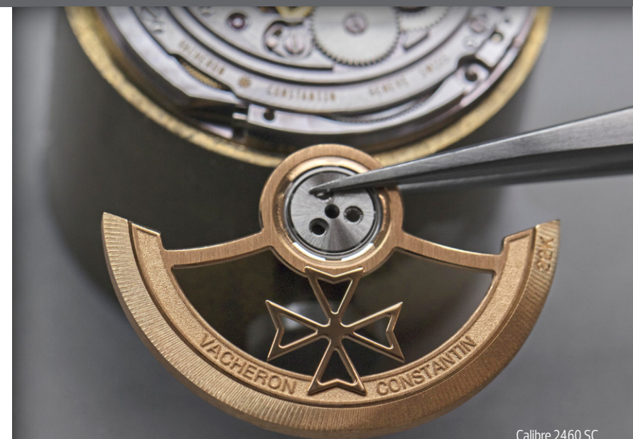
Calibre 2460 SC

Pieza única. Certificado de autenticidad de la reproducción de la obra de arte emitido por el Museo del Louvre. Certificado de garantía emitido por Vacheron Constantin. Certificado con el Punzón de Ginebra.