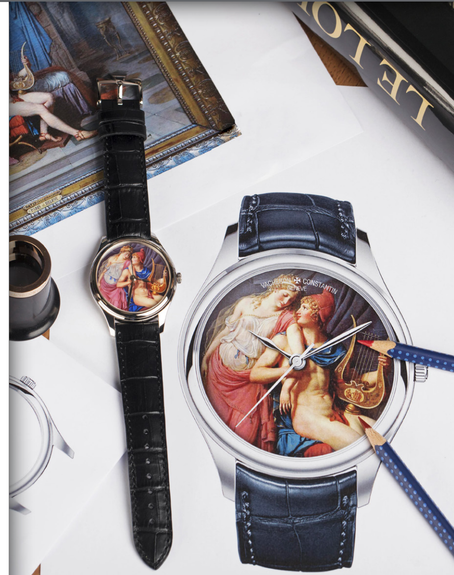
Ejemplo de esmalte en miniatura reproduciendo la obra Los amores de Paris y Helena , de Jacques-Louis David, conservada en el Museo del Louvre.