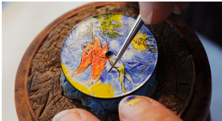
Vacheron Constantin Métiers d'Art – Chagall & l'Opéra de Paris, reloj « Homenaje a los principales compositores». Esfera en miniatura que reproduce un detalle del techo de la Ópera Garnier de París pintado por Marc Chagall en 1964.

Al final de esta exclusiva experiencia, el comprador recibirá su reloj, acompañado de dos certificados de autenticidad, uno de Vacheron Constantin y otro del Museo del Louvre, certificando la reproducción de la obra.