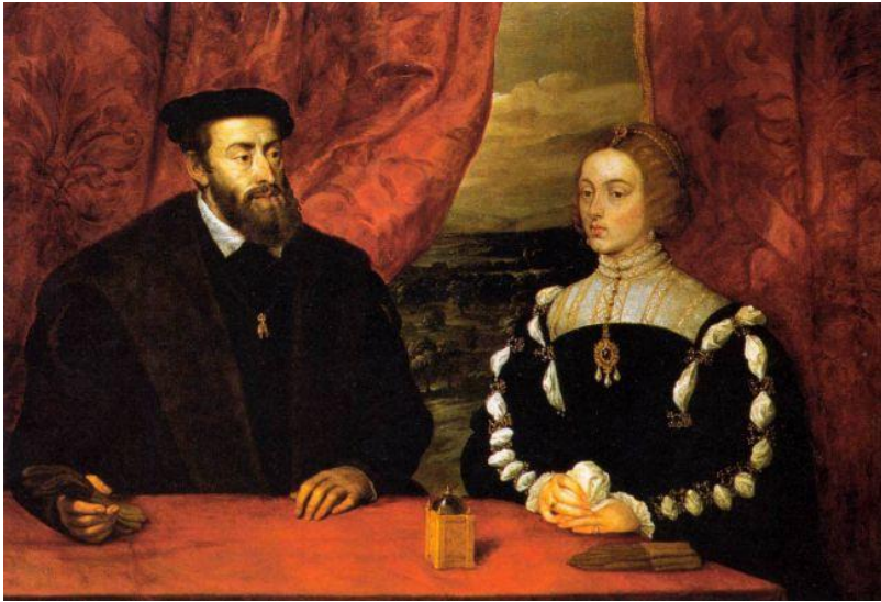
Carlos V e Isabel de Portugal, Tiziano