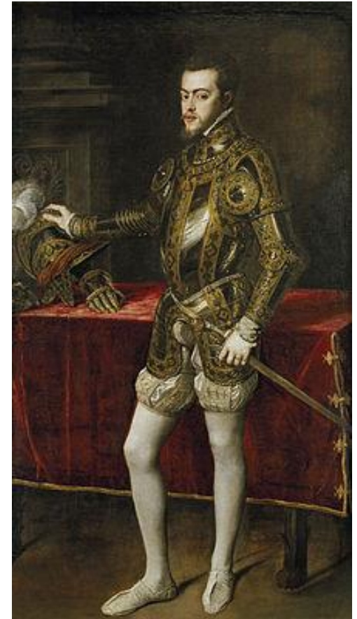
Felipe II, Tiziano