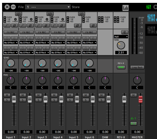
dspMixFx ミキサーアプリケーション (『UR44C』)