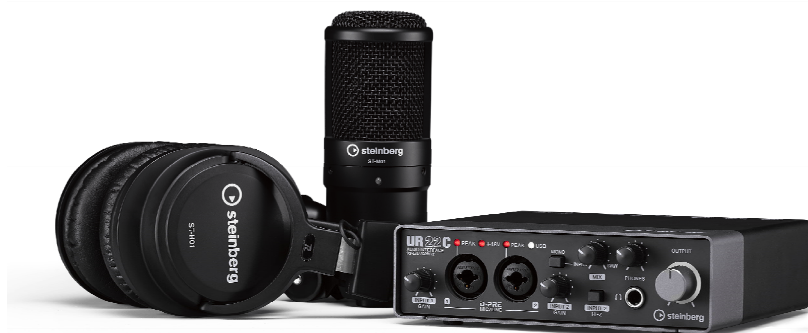
スタインバーグ ハードウェア バンドルパッケージ 『UR22C Recording Pack』