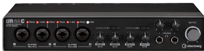
スタインバーグ USB オーディオインターフェース 『UR44C』