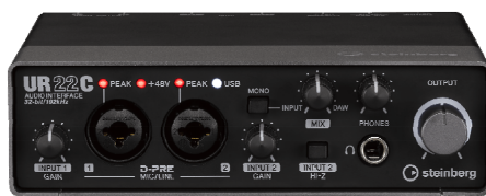
スタインバーグ USB オーディオインターフェース 『UR22C』