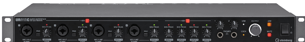
スタインバーグ USB オーディオインターフェース 『UR816C』