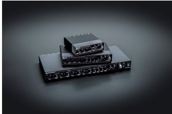
スタインバーグ USB オーディオインターフェース 『UR-C シリーズ』

株式会社ヤマハミュージックジャパン（東京都港区）は、Steinberg Media Technologies GmbH（ドイツハンブルク、以下、スタインバーグ社）とヤマハ株式会社との共同開発による、スタインバーグブランドの USB オーディオインターフェース『UR-C シリーズ』の 4 モデルを 10 月 3 日（木）から順次発売します。