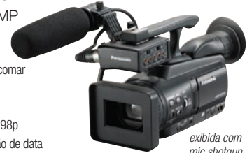
exibida com mic shotgun opcional