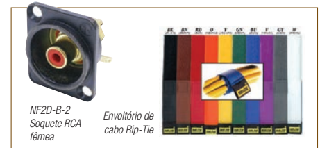
NF2D-B-2 Soquete RCA fêmea

Prendedores de cabo de 4,0" (bolsa de 100) ( RACT10004 ) ..... 9.95 Prendedores de cabo de 8" (bolsa de 100) ( RACT10008 ) ..... 10.99 Prend. cabo reutilizáveis de 8" (bolsa de 100) ( RACT10008R ) ..... 16.50 Dep. Cabo, Modelo CBLD - p/ 30 cabos ( RACBLD ) ..... 12.50