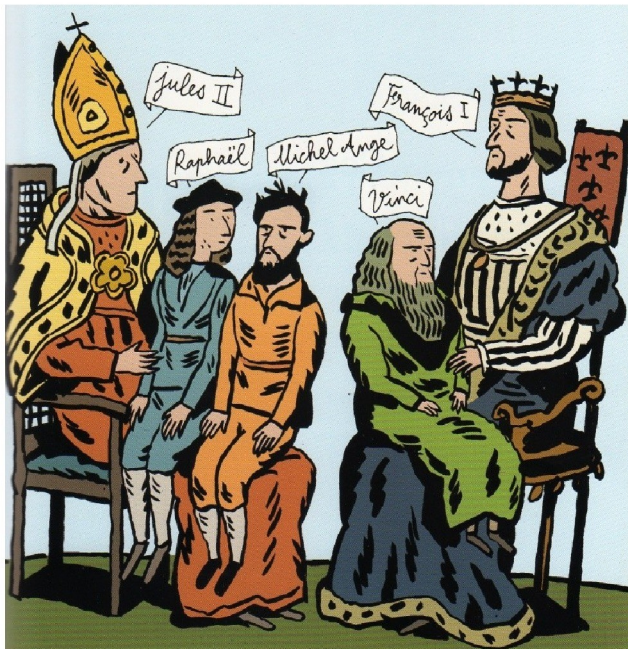
Pauline Piettre et Frédéric Rébena, La Renaissance , coll. « Regard Junior », Un Voyage dans le temps et dans l'histoire, MANGO JEUNESSE. © Tous droits réservés

Sous l'impulsion de quelques mécènes, les artistes développent leur art et réalisent de nombreux chefs-d'œuvre. Les papes, les princes et les rois se disputent les plus grands artistes de la Renaissance.