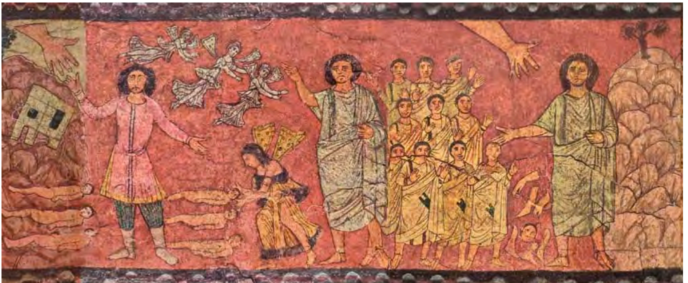
La mano de Dios aparece sobre Ezequiel y la de éste sobre diez hombres. Sinagoga de Dura Tropos

Este célebre texto cuenta cómo Ezequiel, después de recibida la orden, profetiza sobre unos huesos que son la imagen de la casa de Israel. El pueblo, en su desesperación, se enfrenta a una cuestión de vida o muerte. En el destierro lo ha perdido todo. Pero va a recibir el don de la vida por la palabra profética. Un espíritu venido de Dios devuelve la vida a los huesos: la palabra es eficaz, recrea. El pueblo, que vive de nuevo, podrá ser llamado “pueblo de Dios”. No hay que ver en esta visión una afirmación de