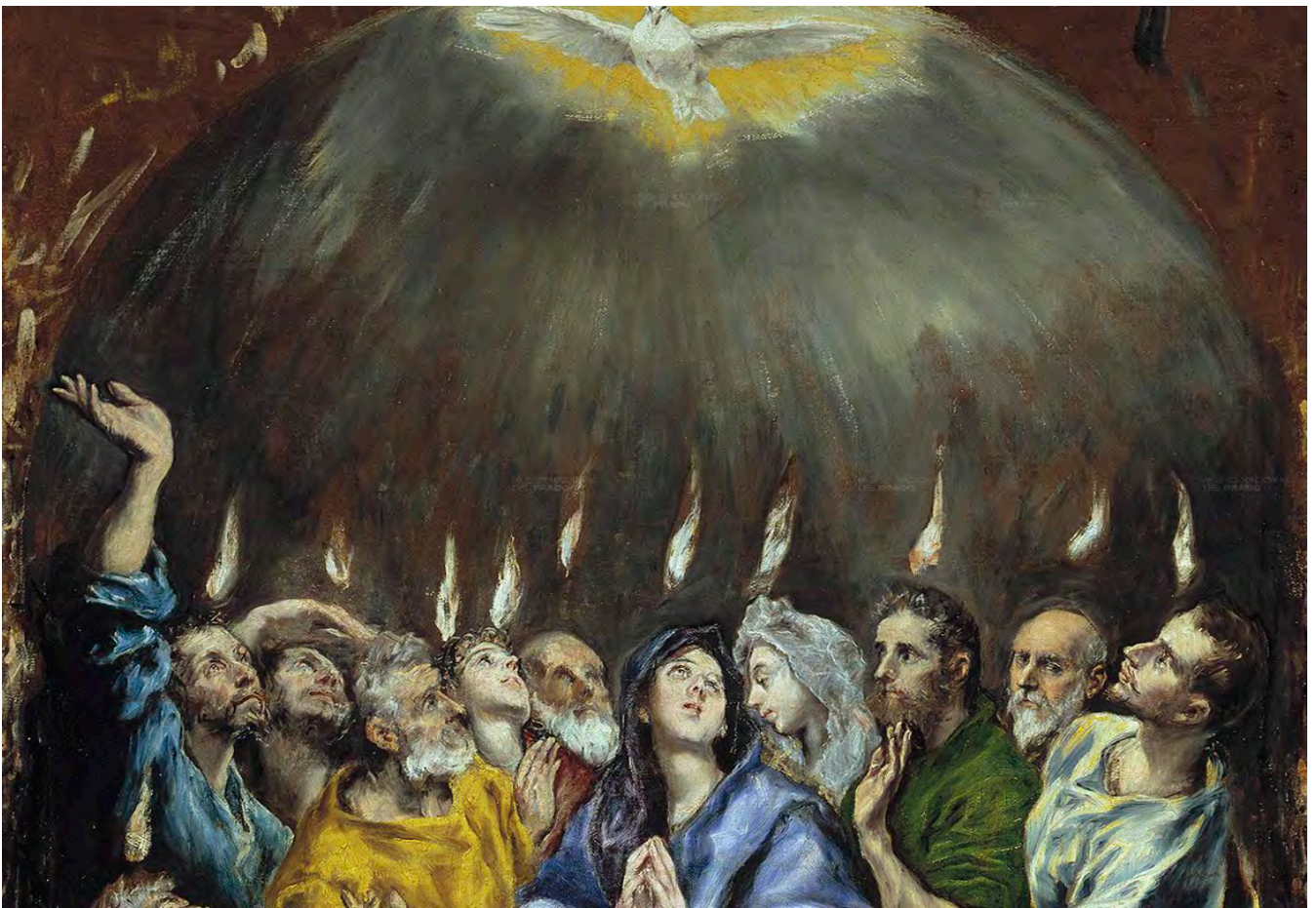
EL GRECO. Pentecostés [detalle]. 1597. Museo del Prado

La tarea que nos brinda es grande. La llevamos a cabo con la fuerza del Espíritu. Nosotros solos podemos hacer muy poco. Nuestra comunión es unión al Espíritu Santo y a los hermanos.