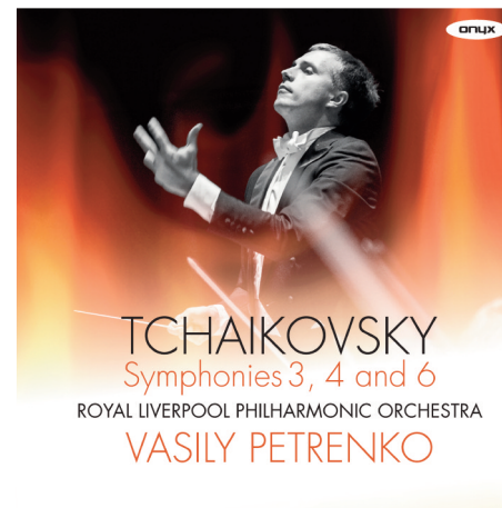
ONYX 4162 Tchaikovsky: Symphonies 3, 4 & 6 Vasily Petrenko, Royal Liverpool Philharmonic Orchestra