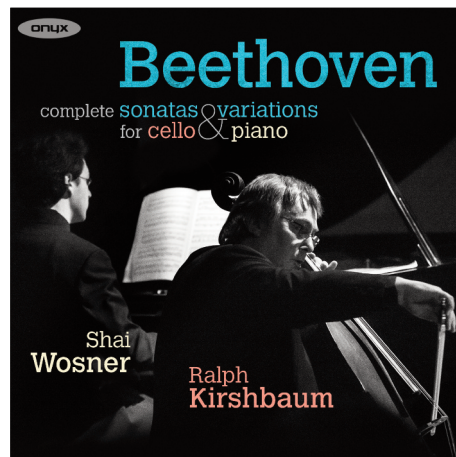
ONYX 4178 Beethoven: Complete Sonatas and Variations for cello & piano Ralph Kirshbaum, Shai Wosner (2CD)