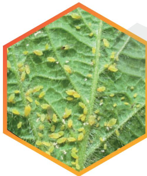
Figura 2. Áfidos en el envés de la hoja de pepino.

Los áfidos, se distribuyen de forma agrupada, pero varía según la densidad y el marco de plantación del cultivo. Estos áfidos se sitúan en el envés de las hojas (Figura 2), y prefieren alimentarse de los órganos de plantas jóvenes y brotes tiernos. Durante la alimentación inyectan saliva que contiene sustancias tóxicas para la planta como puede ser el genoma del CMV ocasionando deformación de hojas.