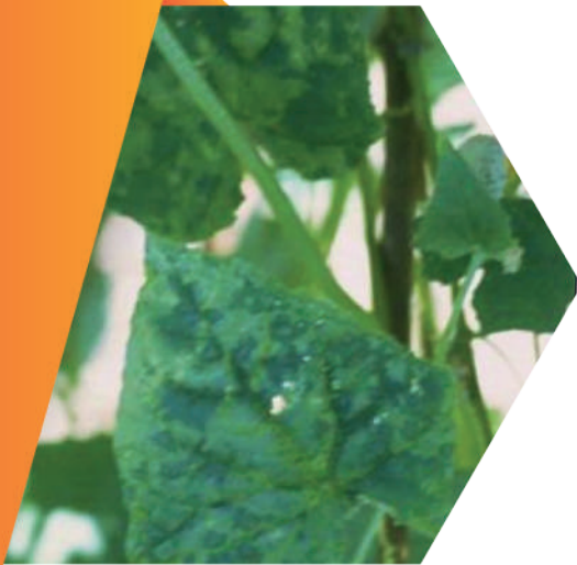
Figura 4. Moteado verde en hoja pepino generado causado por la enfermedad de CMV.

Los síntomas del CMV varían de acuerdo con la estructura del virus y la expresión de los síntomas en el cultivo. El síntoma característico de la enfermedad es el mosaico color verde o amarillo (Figura 4) generado en las hojas del cultivo, color que puede continuar hasta generar clorosis generalizada y finalmente necrosis. Otros síntomas que presenta son el enanismo (disminución del desarrollo de la planta), las hojas comienzan a generar una curvatura, presentan deformación (Figura 5) y reducen el tamaño de la lámina foliar (en casos severos solo quedan las nervaduras de la hoja).