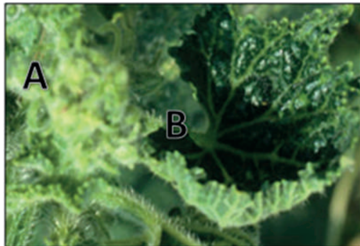
Figura 5. Daño en hoja de pepino (A) formación de roseta y (B) comienzo de la deformación de la hoja causado por la enfermedad de CMV.

Cuando se afectan hojas jóvenes, estas pueden presentar un acortamiento en la longitud de los entrenudos y toman la forma de una roseta (Figura 5). Las flores se distorsionan y presentan en algunas ocasiones pétalos verdes, al igual que disminuye su formación y por consiguiente la generación de frutos. En infecciones severas los frutos quedan pequeños, con malformaciones, de aspecto rugoso en la epidermis y sufren decoloración (Figura 6). La intensidad de los síntomas depende de la especie atacada, cultivar infectado, edad de la planta y condiciones ambientales idóneas para el desarrollo de vectores del virus.