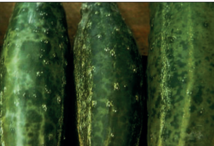
Figura 6. Daño provocado por la enfermedad de CMV en fruto de pepino.