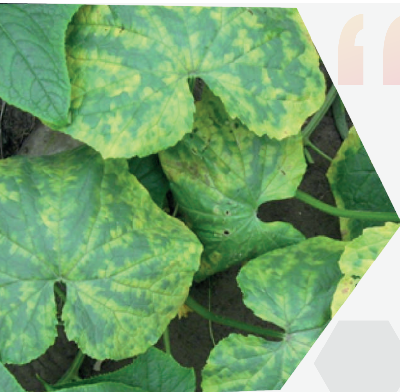
Figura 3. Presencia de CMV en pepino.

El organismo causal del virus mosaico del pepino (CMV) es un virus perteneciente a la familia Bromoviridae , la cual posee la capacidad de infectar más de 900 especies de plantas, principalmente cucurbitáceas, crucíferas, solanáceas y compuestas. Este patógeno es el primer causante de pérdidas económicas en hortalizas cultivadas a campo abierto a nivel mundial. La gravedad de esta enfermedad varía dependiendo de la presencia de los síntomas para su detección, ya que puede generar la muerte total de la planta afectada en tan solo semanas. Cabe resaltar que los virus son difíciles de combatir al no tener control de los vectores de la enfermedad.