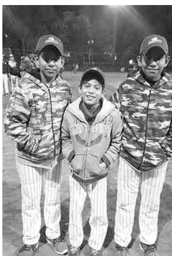
■ Las bujías del equipo Salineros de la categoría 11-12 y 13-14 años en el evento nacional de la liga Petrolera. (TACHUN)