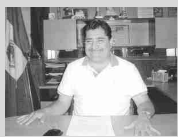
El alcalde Jesús Manuel Garduza Salcedo, impulsando el deporte, celebrará la Primera Copa de Voleibol Regional 2016, en Villa Oluta, fusionándolo a su vez con el arte y la cultura.

“Pues que les puedo decir, pero que ya le paren, nosotros somos ciudadanos trabajadores que tratamos de llevar una vida tranquila y cuando ellos se apoderan de todo lo que trabajamos no se vale, están dejando este estado en la ruina, no le echo la culpa solamente al gobernador, porque fue culpa de todos, por eso están orillando al vandalismo, si nosotros estamos jodidos hay gente aún más que nosotros”.