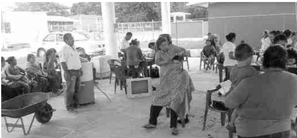
Las jornadas seguirán en diversas comunidades.