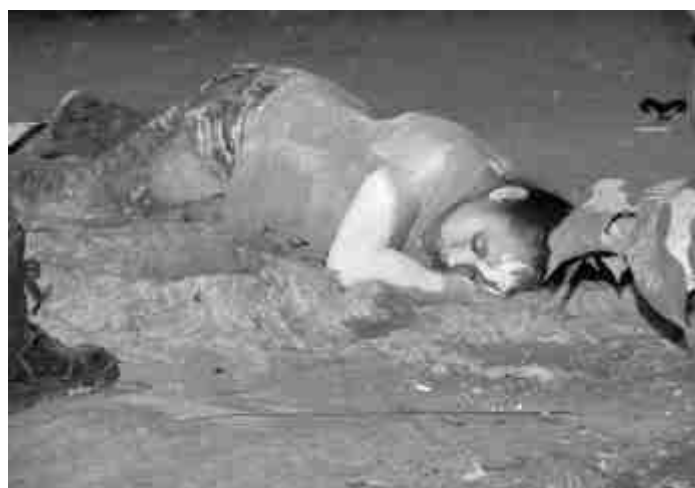
De manera extra oficial quedó confirmado que fue el ex cónyuge de la mesera el que acabó con su vida la noche del pasado domingo en la Colonia Reforma Agraria. (GRANADOS)

Fue cerca de las 21:30 horas cuando dos fuertes detonaciones por arma de fuego alertaron a los habitantes de la citada comunidad sobre la muerte de la nombrada mesera, ya que tras salir vecinos de