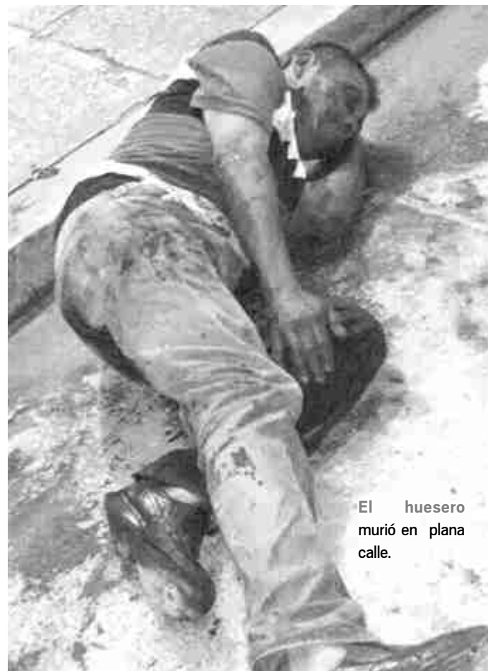
El huesero murió en plena calle.

Lamentablemente, nadie llegó a prestar el auxilio y minutos después