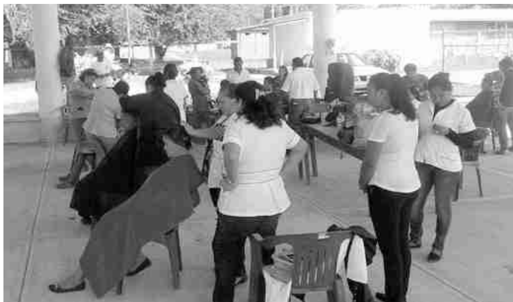
Se realizaron los servicios de corte de cabello en la comunidad de Esperanza Malota.

diversas comunidades, esto de manera conjunta con el Ayuntamiento de Acayucan y a solicitud del mandatario municipal.