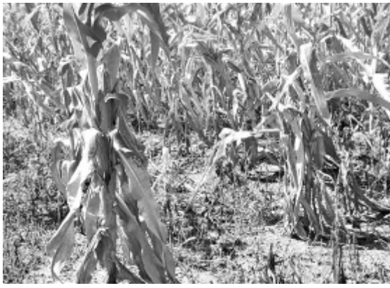
■ Las plagas han afectado a los productores de la zona.