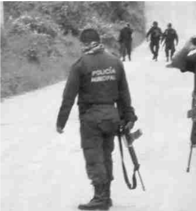
Joven habitante del municipio de Texistepec, fue privado de su libertad la tarde de ayer cerca a la cabecera municipal. (GRANADOS)