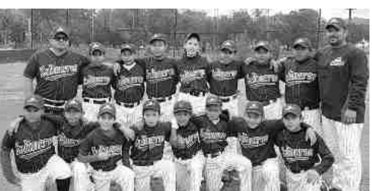
■ La categoría 13-14 años disfrutaron de las mieles del triunfo recibiendo sus reconocimientos de la liga Petrolera. (TACHUN)