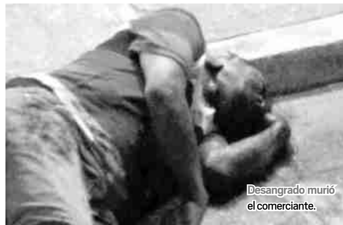
Desangrado murió el comerciante.