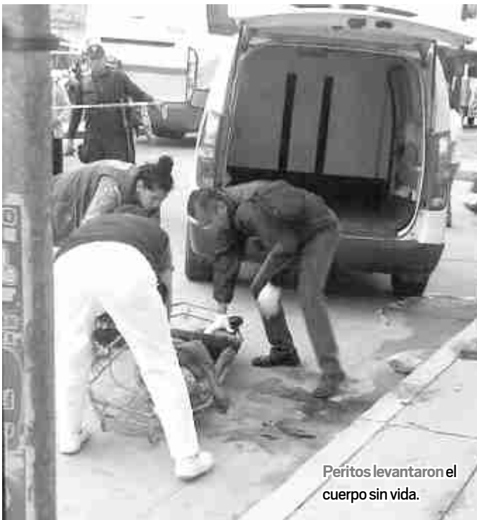
Peritos levantaron el cuerpo sin vida.

el comerciante en medicina naturista falleció desangrado.