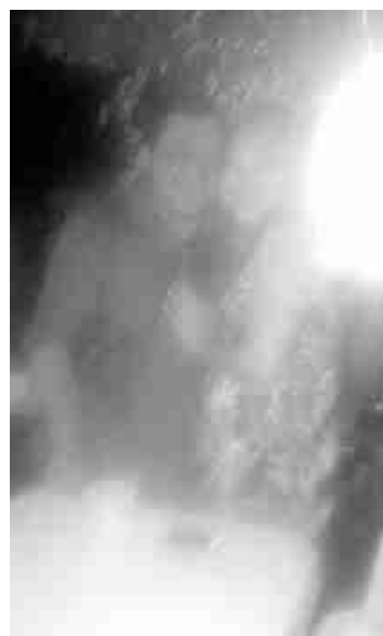
Irrefutable son los abusos que un conocido sayuleño ha cometido en contra de comerciantes de esta ciudad de Acayucan, tras no pagarles el dinero que les solicito. (GRANADOS)

Por lo que los afectados se están viendo en la posibilidad de presentar las denuncias correspondientes en su contra, ya que lo han visto pasear por calles céntricas de esta ciudad Acayuqueña, abordó de un automóvil Chevrolet tipo Cruzier color blanco y placas de circulación YHE-92-68.