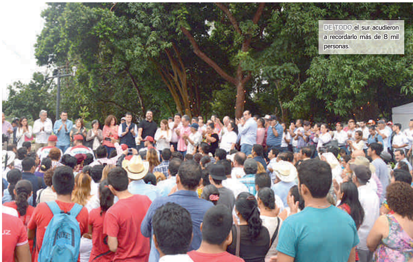
DE TODO el sur acudieron a recordarlo más de 8 mil personas.