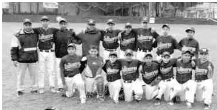
■ La categoría 11-12 años gana pero también perdió, recibiendo todos reconocimientos de la liga Petrolera de México. (TACHUN)

El presidente de la liga Irving Cumplido aún mantiene abiertas las inscripciones a este campeonato que se disputa en las mejores canchas de Acayucan, ya que están totalmente empastadas y además dicho torneo cuando con una muy atractiva premiación, si algún promotor deportivo desea inscribir algún equipo puede acudir a uno de los partidos para contactar al presidente de la liga o puede llamar al teléfono 924 249 9597.