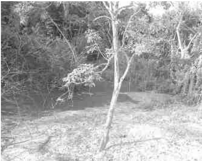
Vecinos de Hipólito Landero reportan animales ponzoñosos debido al limo que ha en las aguas de drenaje

Por lo que piden a los elementos de protección civil que inspeccionen el área, pues ya en varias ocasiones han encontrado víboras al interior de las viviendas.