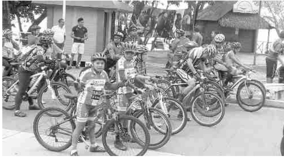
Los Revoltosos ocupan un tercer lugar en la carrera de Catemaco. (Rey)

Ixtagapa doblegó al equipo de Michapan Paso Real con marcador de 2 goles a 0, Michapan tuvo para empatar el partido pero estos fallaron un mano a mano frente al portero, mientras que sus demás oportunidades también mandaron los disparos por un costado, Ixtagapa fue letal y terminó llevándose la victoria.