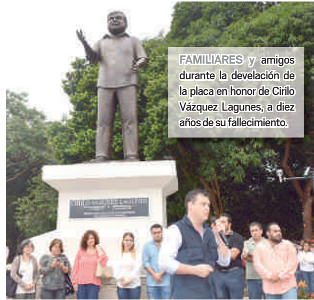
FAMILIARES y amigos durante la develación de la placa en honor de Cirilo Vázquez Lagunes, a diez años de su fallecimiento.

Al evento acudieron Campesinos, alcaldes, diputados locales y federales, empresarios, productores, miles de beneficiados con sus obras, integrantes del Club Tobis de Acayucan campeón de la Liga Invernal Veracruzana y como invitado especial el ex ligamayorista Vinicio Castilla, el mexicano con más jonrones conectados en la gran carpa.