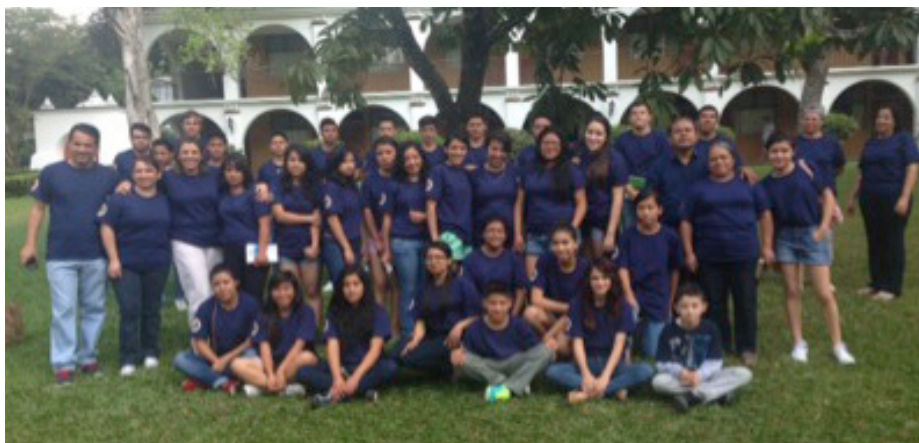
Los jóvenes de Guatemala aprovecharon de estrechar lazos durante el campamento