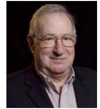
Por David Palmer

Debemos recordar los inspiradores mensajes que escuchamos durante la Fiesta mientras nos enfocamos en el futuro.