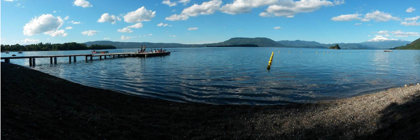
Más de 40 jóvenes disfrutaron del campamento 2014 en Puerto Calafquén