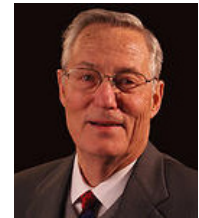
Por Roy Holladay

¡Trabajar con nuestra juventud es una de las inversiones más valiosas que podemos hacer para el futuro de la Iglesia! EC