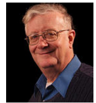
Por Jorge de Campos

Toda la congregación de Maloca de Moscou está muy contenta con el proyecto y agradecida de Dios y de todos los hermanos que ayudaron a financiar y materializar esta idea.