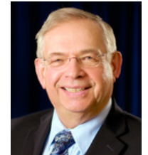
Por Víctor Kubik

¡No es mi culpa! ¿Cuántas veces hemos oído o dicho estas palabras cuando algo sale mal? Casi siempre es lo primero que respondemos, sin pensar siquiera en todas sus ramificaciones. No nos gusta equivocarnos ni ser los responsables de algo desagradable, y rápidamente buscamos maneras de explicar o justificar el fracaso o la adversidad admitiendo nuestra culpa solo como último recurso — si acaso.