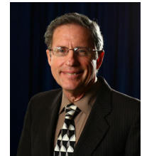
Por Aaron Dean

Hace solo unos cuantos meses celebramos la Fiesta de los Tabernáculos y el Último Gran Día ordenados por Dios, que representan el Milenio y el día del juicio final, cuando todo pecado será eliminado. Ahora hemos vuelto al mundo de Satanás y debemos estar atentos, mientras nos preparamos una vez más para la nueva temporada de fiestas anuales. Éstas son un recordatorio del plan de Dios para que salgamos de este mundo y nos preparemos para entrar en uno nuevo. Alejémonos de la tolerancia. Mantengamos los mosquiteros espirituales bien colocados y dispuestos, para evitar que los “insectos” de este mundo contaminen nuestra esperanza espiritual de vida eterna. EC