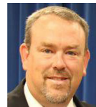
Por Keith Tomes

Enséñeles a sus hijos que Dios es real, que escucha nuestras oraciones y que sus leyes funcionan.