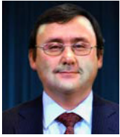
Por Jaime Gallardo