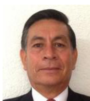
Por Israel Robledo