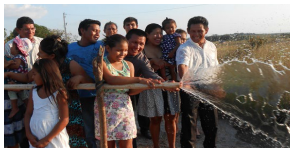
Los miembros se regocijan al ver fluir el agua del nuevo pozo en Maloca.

Los hermanos de Maloca de Moscou están muy felices y agradecen a Dios y a todos los hermanos que ayudaron monetariamente para que este proyecto se convirtiera en realidad. EC