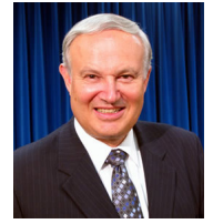
Por Mario Seiglie

Los cuatro evangelios constituyen una de las obras literarias más importantes en la historia de la humanidad, ya que se refieren a la vida de Jesucristo como Dios en la carne.