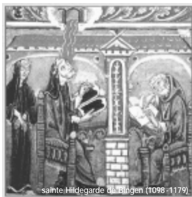
sainte Hildegarde de Bingen (1098-1179)