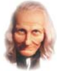
Saint Jean-Marie-B. Vianney, le "Saint Curé d'Ars"

"Mais, en ces derniers temps du monde, c'est à tous que Je demande d'être des saints, tout simplement du fait de Me laisser libre en eux, de Me refléter en chacun, tout à ma guise" (...)