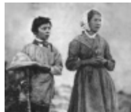
Maximin et Mélanie

Oui, les prêtres demandent vengeance, et la vengeance est suspendue sur leurs têtes. Malheur aux prêtres et aux personnes consacrées à Dieu, lesquelles, par leurs infidélités et leur mauvaise vie, crucifient de nouveau mon Fils ! (...)