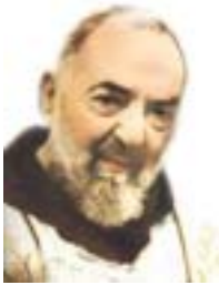
Saint Padre Pio

Alors que j'avais remis mon esprit et mon corps entre les mains de notre Seigneur Jésus-Christ, j'eus la surprise de me voir en train de commencer la réalisation de cet ouvrage en me servant d'éléments de mon site Web consacré aux apparitions mariales.