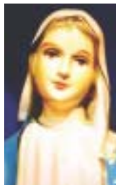
Notre Dame de Najou.