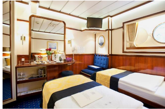
Cabine Catégories 2 à 4