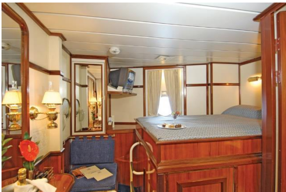
Cabine Catégorie 5