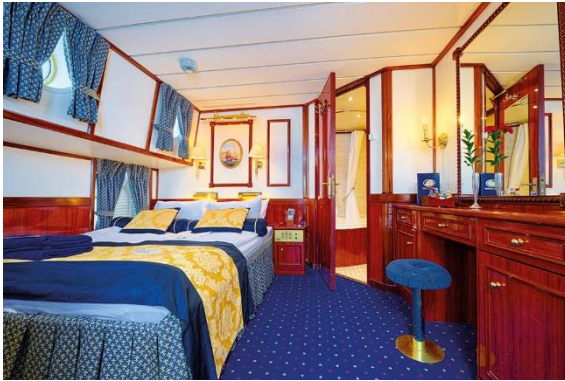
Cabine Catégorie 1

Toutes les cabines sont équipées de salle de douche, sèche-cheveux, coffre-fort, téléphone (par satellite « Navisat »), télévision via satellite (sauf les cabines de cat. 6) et lecteur DVD. Les cabines cat.1, disposent également d'un minibar, d'un écran plasma et d'une baignoire « Jacuzzi ».