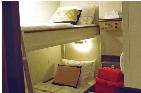
Cabine Catégorie 6

Petit déjeuners et déjeuners sont servis sous forme de buffet à thème au Restaurant. Le dîner est servi « à la carte » dans le Restaurant. Un bar est à disposition toute la journée !