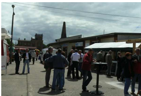
Bild : Hafenfest in Wriezen