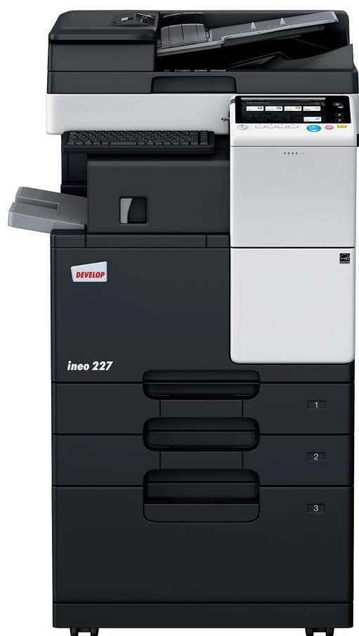
ineo 227 con Alimentatore documenti (DF-628), Finisher interno (FS-533), Mobbiletto con cassettoni (PC-413) e supporto per tastiera (KH-102)

Uffici, scuole, università, studi di architettura o di ingegneria, agenzie di assicurazioni, banche, biblioteche, librerie: molte aziende e organizzazioni di medie e piccole dimensioni non necessitano realmente del Colore. Ciò di cui i loro utenti hanno realmente bisogno è un sistema multifunzione monocromatico, facile da usare e che offra accessi mobile per il crescente numero di utenti mobile all'interno degli uffici.