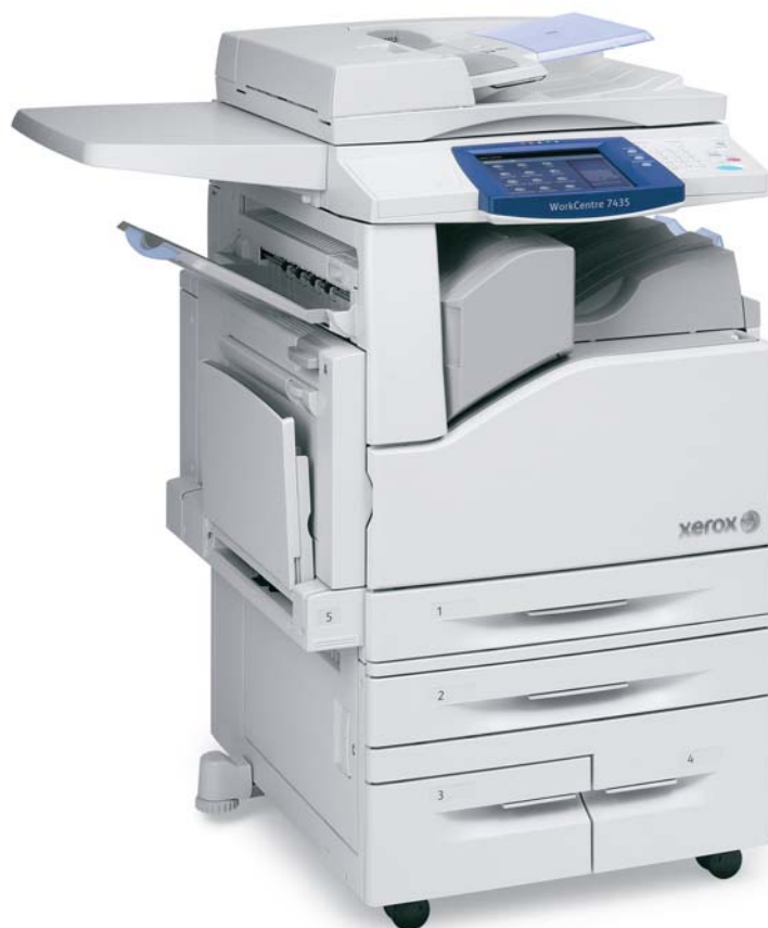
WorkCentre 7435 con Superficie de trabajo, Bandeja Tándem de alta capacidad y Acabador de oficina integrado.